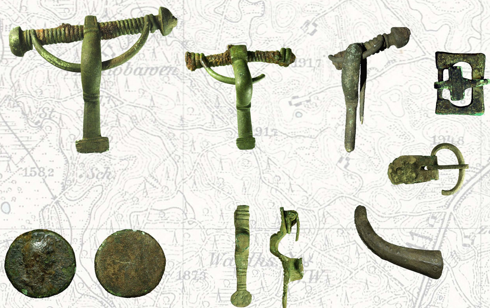
Zabytki z cmentarzyska