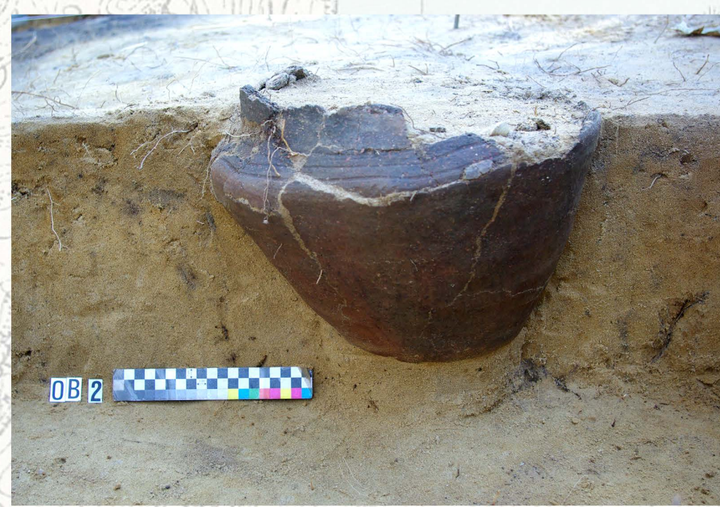
Profile grobów popielnicowych Popielnica nr 17 nakryta dnem dużego naczynia