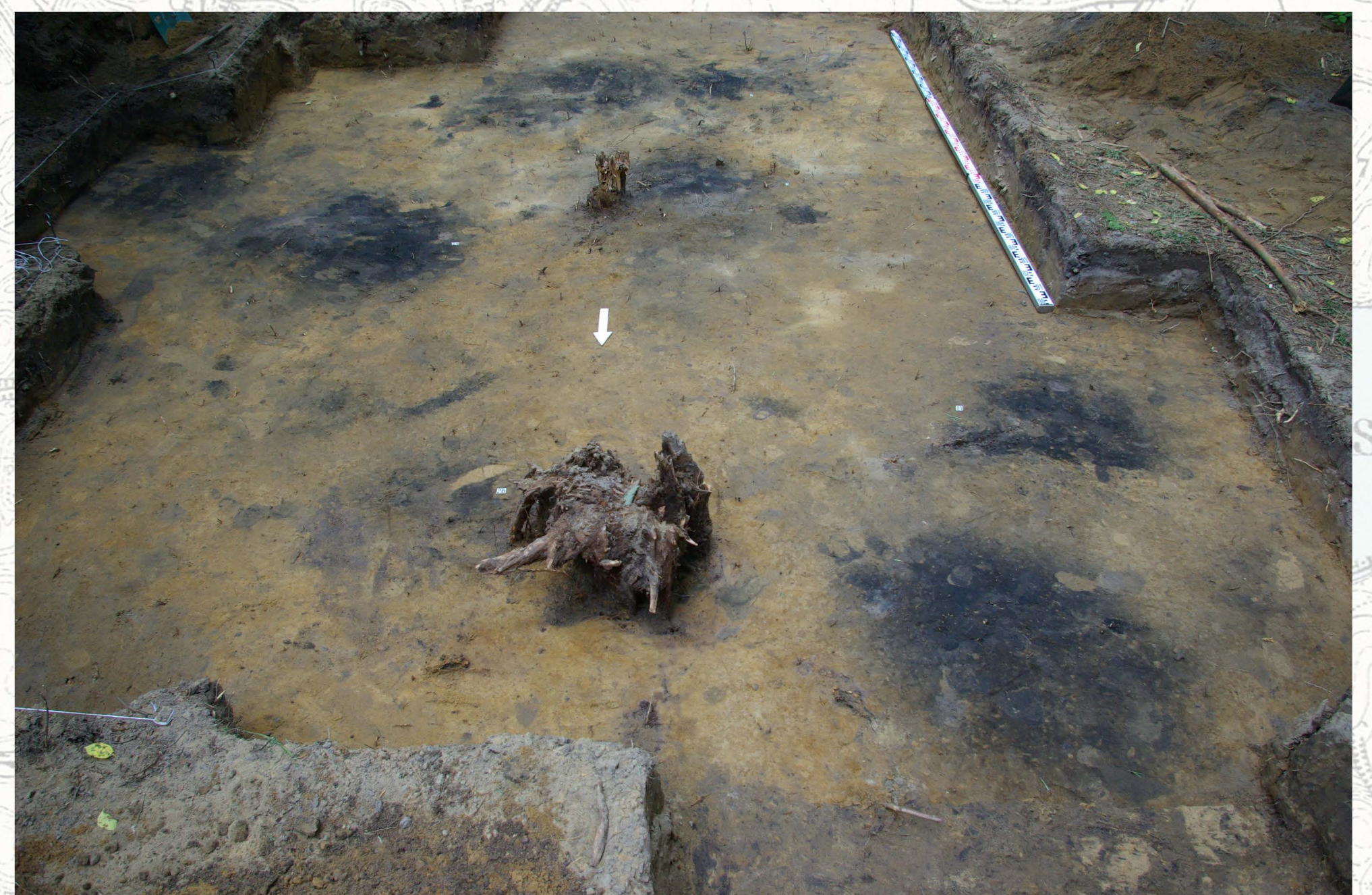
Stropy grobów jamowych