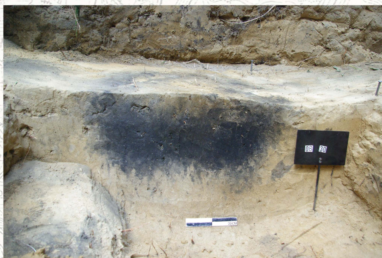
Plan i profil grobu jamowego