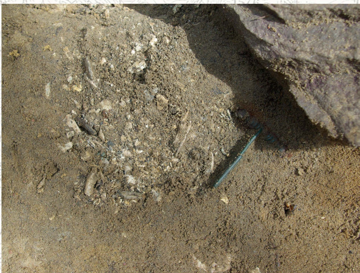
skupisko nr 1