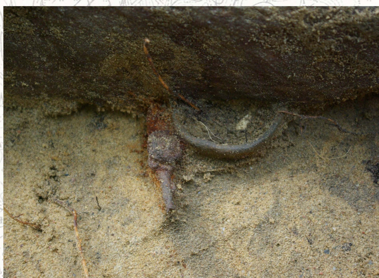
skupisko nr 6