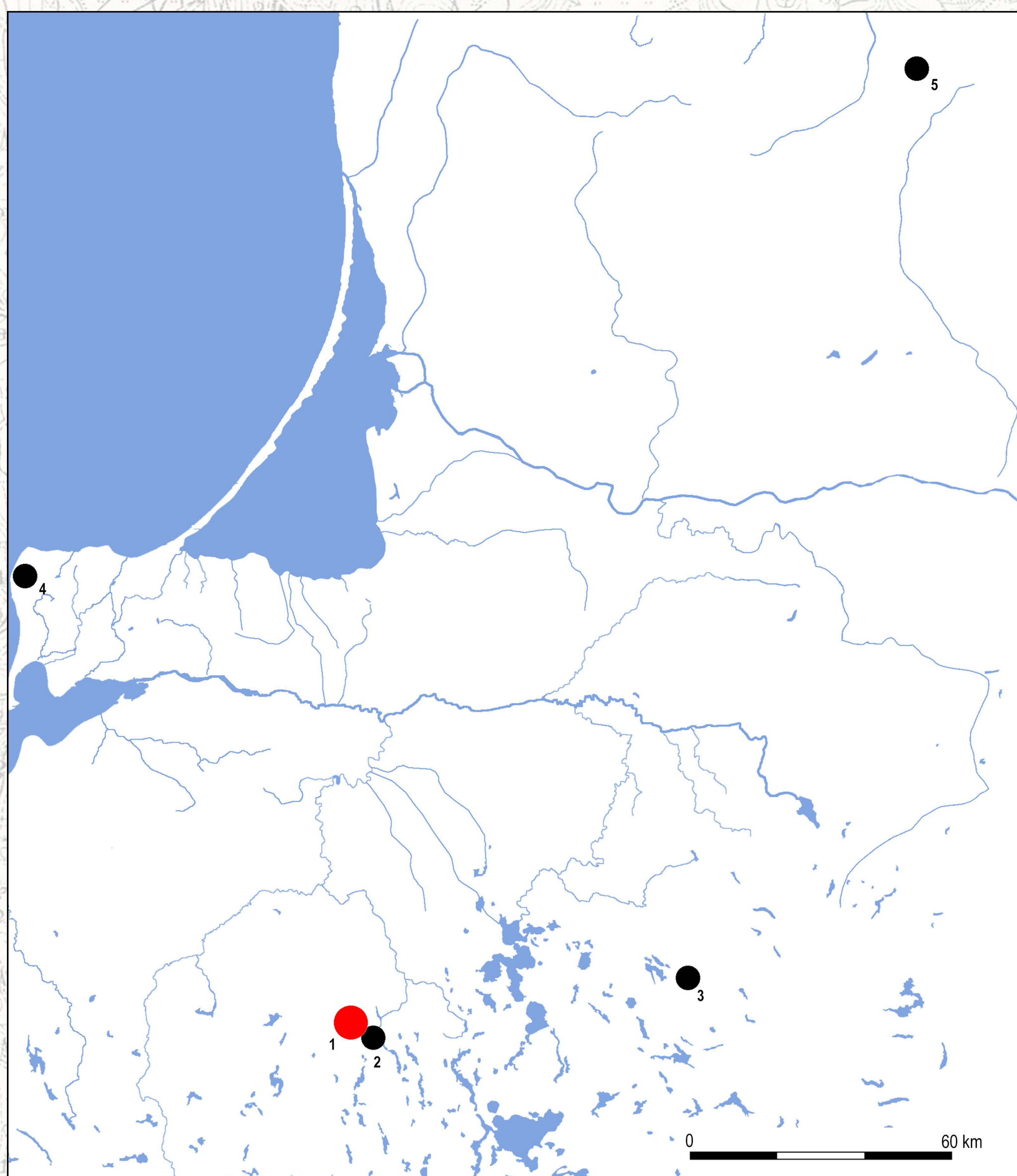
Rozmieszczenie zapinek cykadowych na terenach bałtyjskich 1. Łężany, 2. Widryny, 3. Czerwony Dwór, 4. Grebieten, 5. Šauginai

Zapinki cykadowe występują w wielu różnych wariantach stylistycznych. Niewielkie fibule o kulistej główce cykady z dość długą szyjką, zakończone odwołkiem z rozłożonymi skrzydłami, takie jak te znalezione w Łężanach, najczęściej spotykane są w zespołach datowanych na fazy D 2 -D 3 . Według M. Mączyńskiej zapinki cykadowe tego typu przybyły na tereny bałtyjskie z południa, najprawdopodobniej z nad środkowego Dunaju lub Krymu. (Mączyńska 2009; Skvortsov, Rudnicki, w druku)