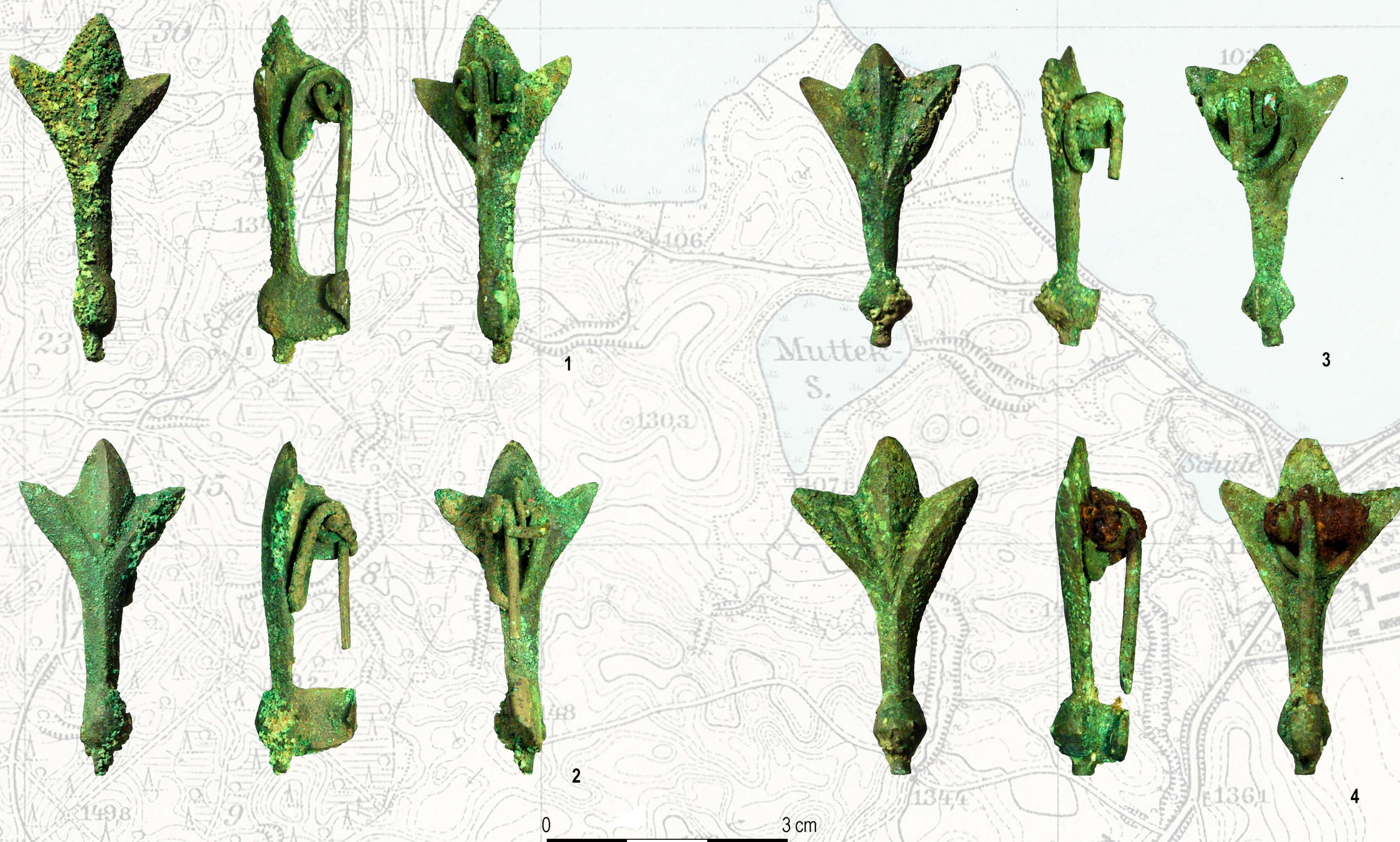
Zapinki cykadowe z grobu 31a 1-2 skupisko B1, 3-4 skupisko B2

Zapinki cykadowe są ozdobą rzadko spotykaną na terenach bałtyjskich, dotychczas poza zabytkami z Łężan znane są z tego obszaru jeszcze tylko cztery takie fibule.